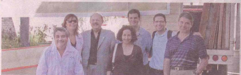
התקבלו במחייאת כפיים. משלחת הרופאים בנייאפס (משמאל) והמארחים